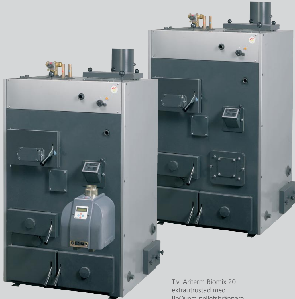
T.v. Arterm Biomix 20 extrautrustad med BeQuem pelletsbrännare.